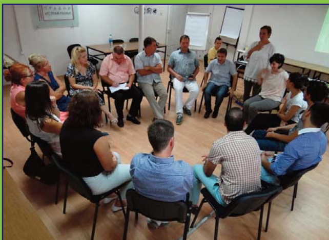
Trening ti adrare lucru tu tim shi coordinare a activitātslor cu membrilj al SIT tu model sculiurle primare, tsānutā Scopia.