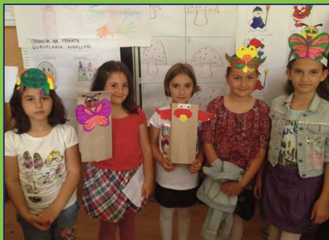
Manifestatsie scularā integratā tu multilingvala model SP "Bratstvo Edinstvo" di Ohārda. Scular di diferente limbe ti ānvitsare lucreadzā deadun tu adrare producti creative.