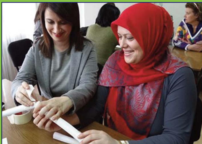
Partisipantsā creative ti trening ca sculie model.