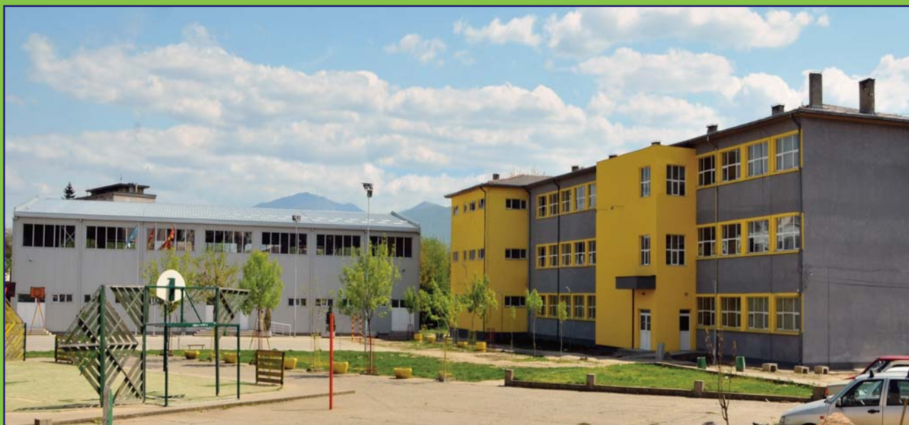
Renovata SP "Nicola Carev" di Coceani iaste unā di unāspārle sculiur renovate tu anlu 2013. Sculia "Nicola Carev" ira bāgatā pi renovare completā ānrelatsie cu situatsia di tu aghurhita, haristusindalui a partneriļja anamisa di PMIO, Minsiteruatlu ti educatsie shi shcintsā, Comuna Coceani shi sculia.