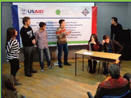
Forum teatru odā ti lucru tsānutā cu scular reprezentantsā di tute sculiur di mese di Tetova. La aiste ode ti lucru, scularlji aduc detsizie ti data situatsie cu giucare ca acter. Aistā iaste unā di tute optu ode ti lucru tsānute pi tu Machedonie.