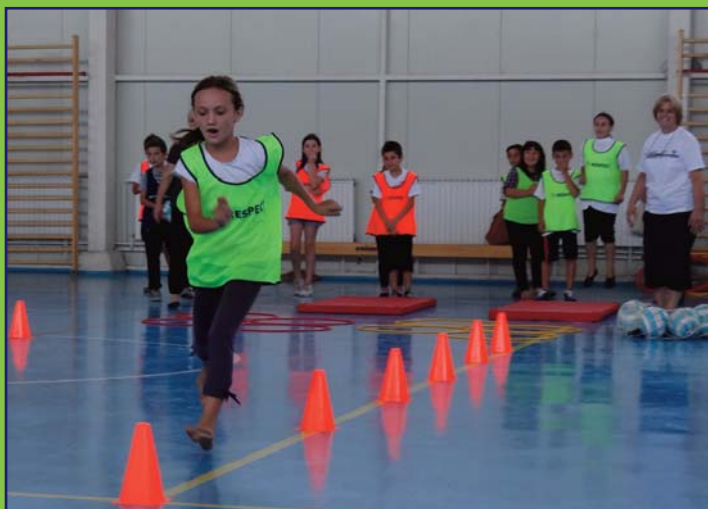
Activitāts deadun tu sportu shi ti arāzbunare tu SP "Adem Yashari", comuna Ceair.