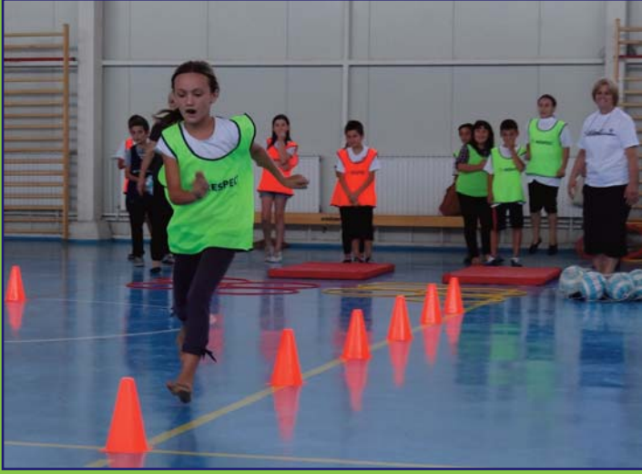
Çayır Belediyesi "Adem Yaşari" İlkokulu'nda ortak eğitim ve spor faaliyetleri