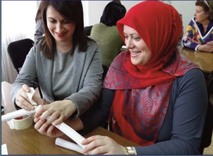
Model okul eğitimine yaratıcı katılımlar