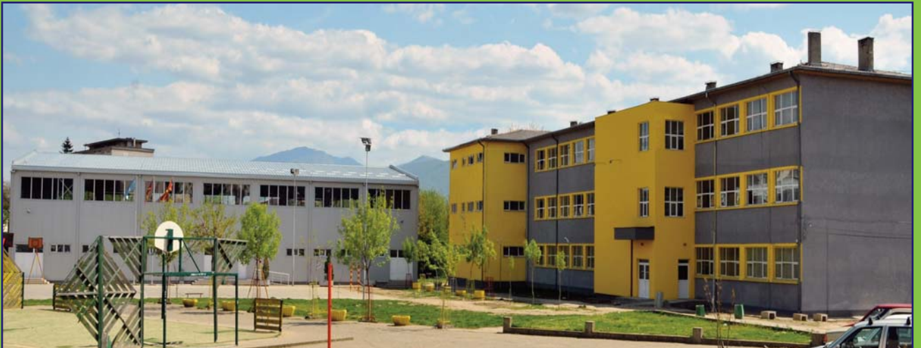
Onarımı gerçekleştirilen Koçani "Nikola Karev" İlkokulu, 2013 yılı kapsamında yenilenmiş olan onbir adet okuldan bir tanesidir. EEEP, Eğitim ve Bilim Bakanlığı, Koçani Belediyesi ve söz konusu okul işbirliğinde yürütülen çalışmalar kapsamında, Koçani "Nikola Karev" İlkokuluna ilişkin ayrıntılı onarım yapılmıştır.