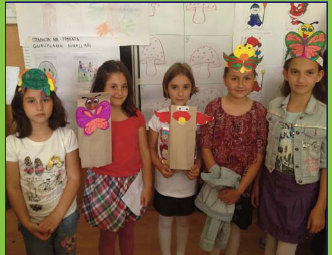
Birkaç dilde eğitim sunan Ohri "Bratstvo Edinstvo" Model İlkokulu'nda entegre okul kutlaması. Farklı dillerde eğitim gören öğrenciler, yaratıcı ürünler elde etmek üzere ortak çalışmalar gerçekleştirir.