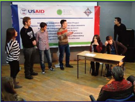
Kalkandelen'deki tüm lise öğrenci temsilcileriyle düzenlenen Tiyatro Çalıştay Forumu. Sözkonusu çalıştaylar çerçevesinde öğrenciler, rol yaparak verilen duruma çözüm bulmaya çalışırlar. Bu çalıştay, Makedonya'da düzenlenen toplam sekiz adet çalıştaydan biridir.