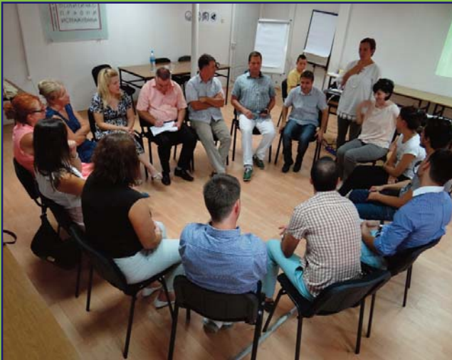
Üsküp'te düzenlenen ve model ilkokullardaki SİT üyelerinin faaliyetlerini kapsayanlar arasında Ekip Çalışması ve Faaliyetleri Koordine Etme Eğitimi.