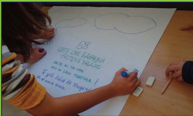
„Сви смо једнаки, растемо заједно“ - њорука учесника заједничких ученичких активности између њаршнерских школа ОШ „Беса“ из села Вешала, Тејово, и ОШ „Никола Вајцаров“ из Сџирумице. У џоку 2013. џодине формирана су 52 њаршнерсџива између 128 школа које заједнички реализују своје активности.