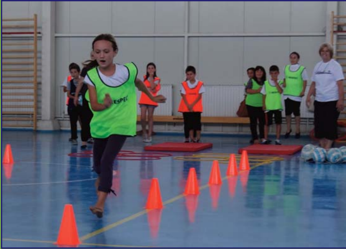
Заједничке спортске и забавне активности у ОШ "Адем Јашари" у ошћини Чаир