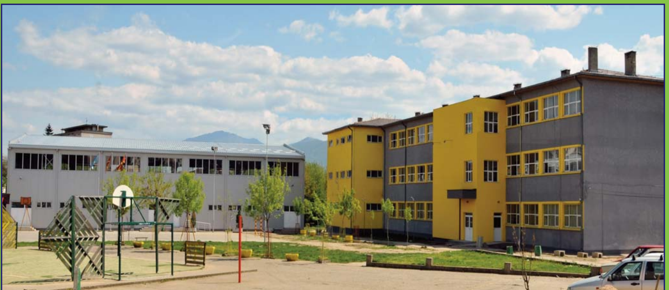
Реновирана ОШ "Никола Карев" из зграда Кочани је једна од једанаесџи школа реновираних у ишоку 2013. године. Школа "Никола Карев" је била комплетино реновирана у односу на своје њрвобитно сџање захваљујући њаршнерсџије између ПМИО, Минисџарсџије њросвете и наука, Оџшџине Кочани и саме школе.