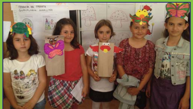
Инићерисани школски доџађај у вишејезичној модел ОШ "Брајсџиво јединсџиво" у Охриду. Ученици из различитих наставних језика раде заједно на сџварању креативних производа.