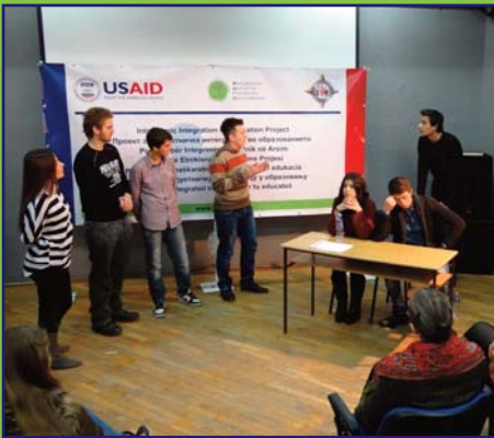
Форум шеаџар радионица одржана са ученицима - њредставницима свих средњих школа у Тешову. На овим радионицама, ученици решавају дању ситуацију кроз глуму. Ово је једна од укуйно осам радионица одржаних широм Македоније.