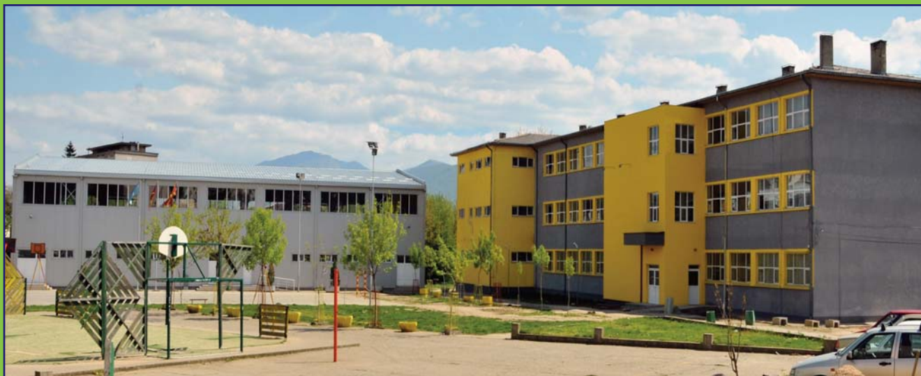
I renovirime FS „Nikola Karev“ taro Kočani si jek taro dešujek sikljovne renovirime ko 2013 berš. I sikljovni „Nikola Karev“ sine kompletno renovirime ko vjavahari e avgune haleja šukrikerindor e partneribaske maškar PMIE, Ministeriumi baš edukacia thaj vigjani, Komuna Kočani thaj i sikljovni.