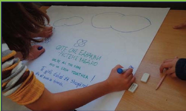
„Sarine sijam jek, barjovaja barabar“-mesaži taro participantia ko barabarutne siklengere aktivipa maškar partnernikane sikljovne FS “Bess” taro gav Vešala, Tetovo, thaj FS „Nikola Vapcarov“ tari Strumica. KO vakti taro 2013 formirime si 52 partneriba maškar 128 sikljovne kola barabar realizirinen pe aktivipa.