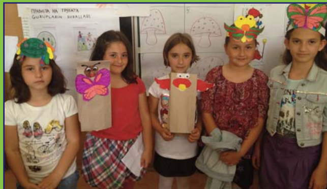
Integririme sikljovnakere manifestacie ko butederčhibjengoro FS „Bratstvo Edinstvo“, tar Ohrid. Sikle taro turli siklanakere čhibja barabar kergje kreativna produktia.