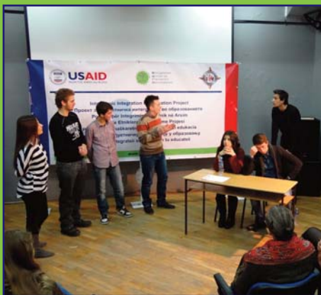
Forum pozorišne radionice održane s đacima predstavnicima iz svih srednjih škola u Tetovu. Na ovim radionicama, đaci rješavaju zadate situacije kroz glumu. Ovo je jedna od ukupno osam radionica održanih širom Makedonije.