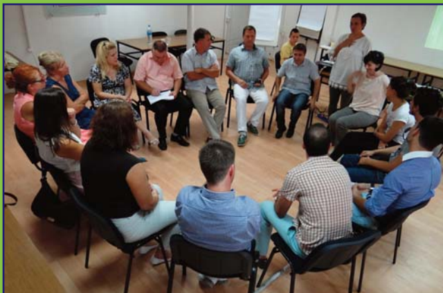
Obuka za gradnju timskog rada i koordinisanja aktivnosti za članove SIT-a u osnovnim školama-uzorima, održana je u Skoplju.

predstava sa zajedničkim predstavljanjem učenika svih jezika nastave. Također, organizovana je i radionica za spravljanje tradicionalnih slatkiša za Kurban-bajram.