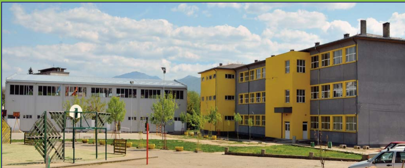
Renovirana OŠ "Nikola Karev" iz Kočana je jedna od jedanaest škola renoviranih u 2013. godini. Škola "Nikola Karev" bila je podvrgnuta potpunom renoviranju u odnosu na prvotno stanje sve zahvaljujući udruženosti između PMIP, Ministarstva obrazovanja i nauke, Općine Kočani, i škole.