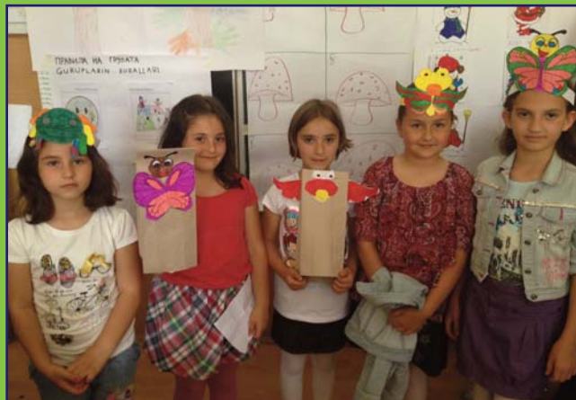
Integrisana školska manifestacija u višejezičnoj OŠ "Bratstvo-Jedinstvo" u Ohridu. Učenici različitih nastavnih jezika zajednički rade u izradnji kreativnih produkta.