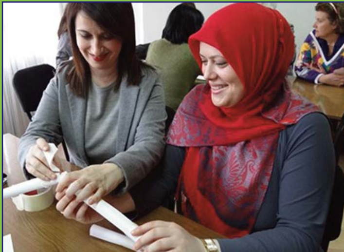
Kreativni učesnici obuke za škole-uzore.