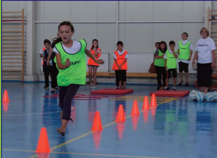
Zajedničke sportske i zabavne aktivnosti u OŠ „Adem Jašari“, u općini Čair