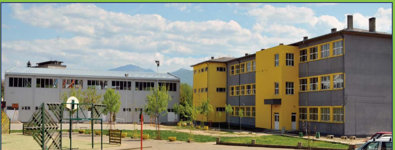
Rinovimi i SHF "Nikolla Karev" nga Koçani është një nga njëmbëdhjetë shkollat e rinovuara në vitin 2013. Shkolla "Nikolla Karev" i është nënshtruar një rinovimi komplet në lidhje me gjendjen fillestare duke iu falënderuar partneritetit midis PINA-s, Ministrisë së Arsimit dhe Shkencës, Komunës së Koçanit dhe shkollës.