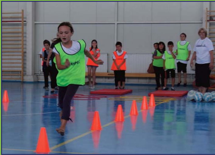
Aktivitetet e përbashkëta sportive dhe argëtuese në SHF "Adem Jashari", komuna Çair.