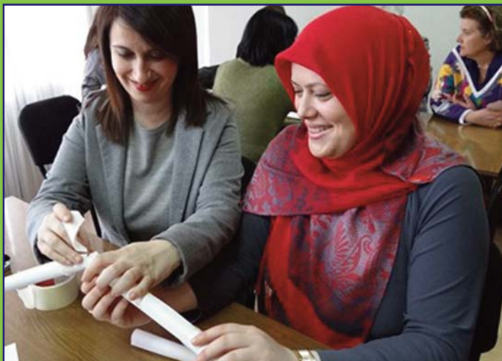
Pjesëmarrës kreativ në trajnimin për shkolla modele cila u mbajt në Shkup