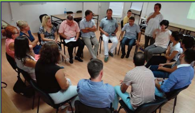
Trajnim për ndërtimin e punës ekipore dhe koordinimin e aktiviteteve për anëtarët e SIT në shkollat fillore modele, i mbajtur në Shkup.